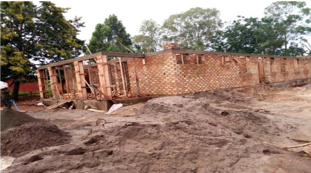
Picha Na. 2: Jengo la Sehemu ya Upasuaji, Kituo cha Afya-Mabawe Wakati wa Ufuatiliaji

Kituo cha Afya cha Mabawe kulikuwa na ujenzi wa Jengo la Upasuaji (Theatre), Jengo la wagonjwa wa ndani (IPD Ward), Nyumba ya Daktari Mfawidhi (Nyumba ya mtumishi). Ujenzi huu ulifanyika kwa kutumia utaratibu wa “Force Account” kujenga pasipo kutumia wakandarasi.