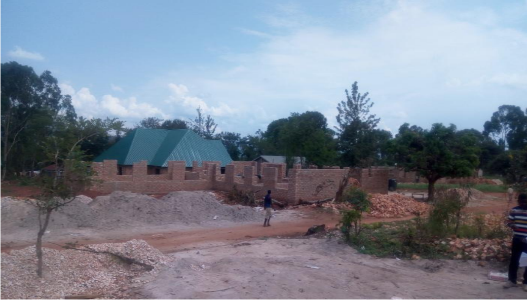
Picha Na. 1: Jengo la Wodi ya OPD, Kituo cha Afya-Murusagamba Wakati wa Ufuatiliaji

Kituo cha Afya cha Mabawe kulikuwa na ujenzi wa Jengo la Upasuaji (Theatre), Jengo la wagonjwa wa ndani (IPD Ward), Nyumba ya Daktari Mfawidhi (Nyumba ya mtumishi). Ujenzi huu ulifanyika kwa kutumia utaratibu wa “Force Account” kujenga pasipo kutumia wakandarasi.